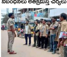
గణపతిగూడెం, ఏప్రిల్ 4 (యేదార్పణ): ప్రభుత్వం ఈ నియమాలు అమలు చేస్తుంది.

నిబంధనలు అతిక్రమిస్తే చర్యలు తీసుకుంటారు. ప్రభుత్వం ఈ నియమాలు అమలు చేస్తుంది.