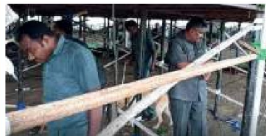
వికారాపేట, ఏప్రిల్ 4 (యేదార్పణ): రూరల్ మండల కుటుంబ సంక్షేమ కార్యకర్తల సమన్వయ కమిటీ సభకు ఏర్పాట్లు చేస్తున్నారు.